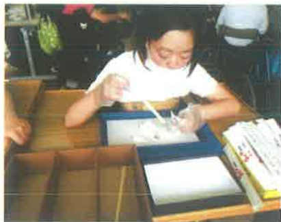
割り箸分別・回収