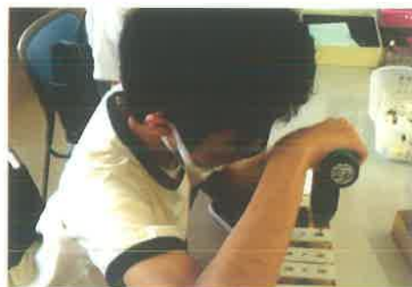
つえポンねじしめ