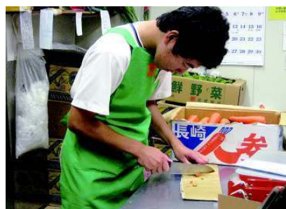
働く喜び・感謝される喜び