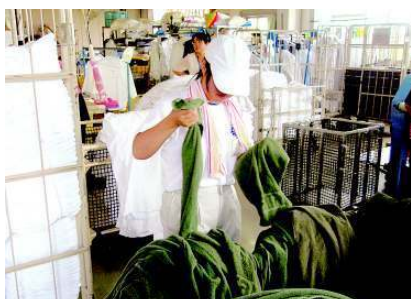
健康・体力・忍耐力