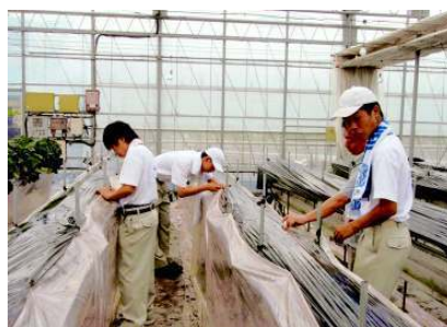
協調性・コミュニケーション