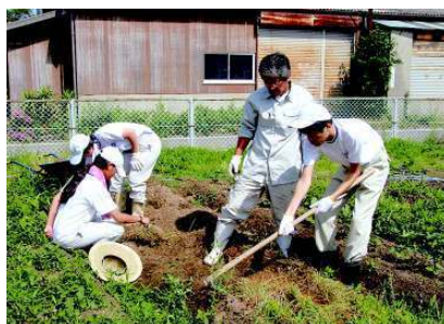
正しい作業手順・理解