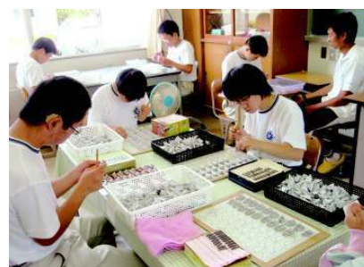
原料・製品への愛情