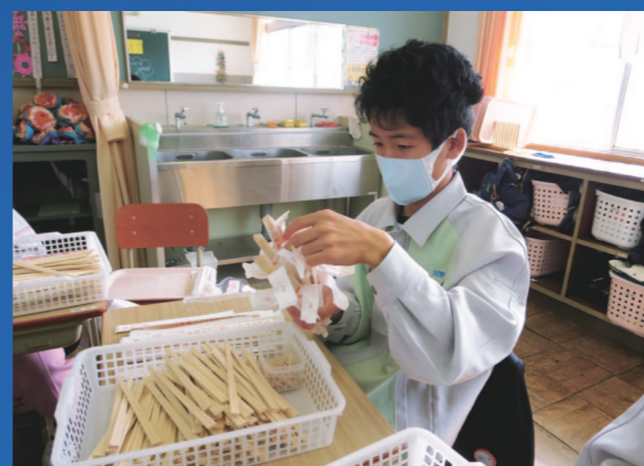
●校内実習の様子(割り箸の検品作業)