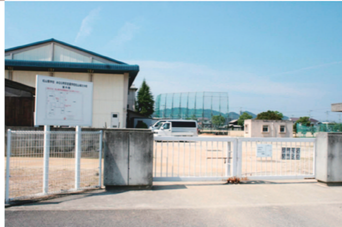
松山城北分校 通用門