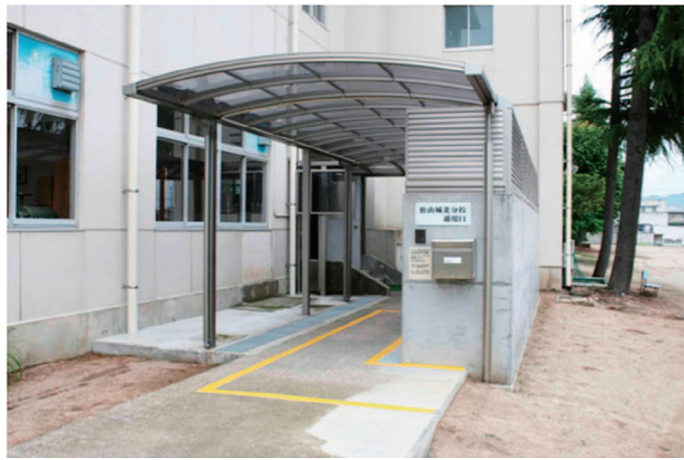
松山城北分校 入口