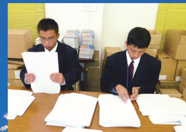
●現場実習の様子(封筒入れ作業)