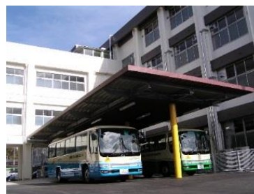
正面玄関前 スクールバス