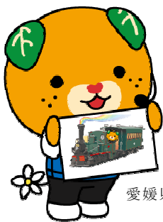
愛媛県イメージアップキャラクター みきやん

◇ 開館時間 9：40～18：00 〔初 日7月30日は、13：00より〕 〔最終日8月 4日は、16：00まで〕