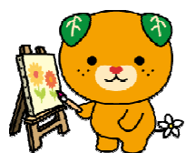
愛媛県イメージアップ キャラクター「みきゃん」

講演では、御自身の子育ての経験をもとに、発達障がいのある子どもの理解や関わり方について、また、自立と社会参加のために何が必要なか等について、具体的にお話しいただきます。