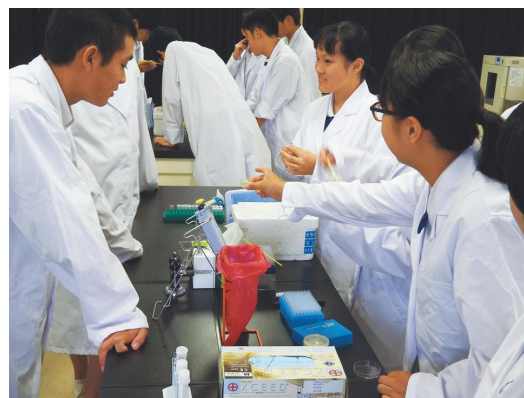
理科の授業 ～実験によるデータ収集～