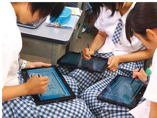
タブレットを活用した アクティブ・ラーニング