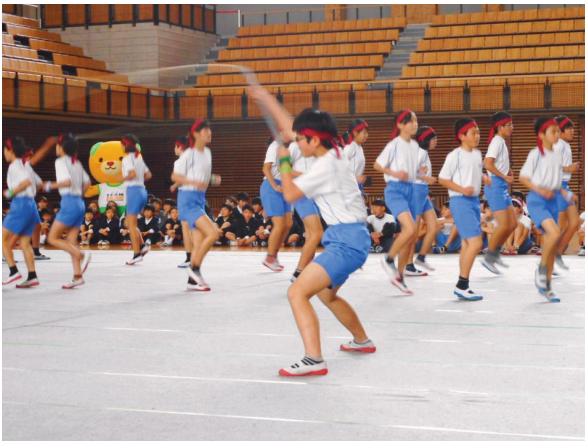
長縄跳びにチャレンジ！

また、各種研修の充実等を通じて、教職員一人ひとりの専門的知識・能力や倫理観の向上に努めるとともに、自信を持って教壇に立ち、明るく安心して働くことができるよう、学校における働き方改革を進めます。