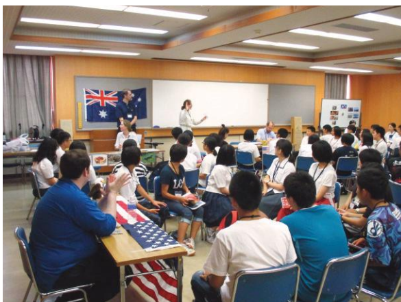
外国人講師による英語学習