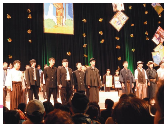
特別支援学校生徒によるミュージカル

さらに、一人ひとりの社会的・職業的自立に向けて必要な基盤となる能力や態度を育むため、発達の段階に応じたキャリア教育を推進し、障がいのある子どもたちの自立と社会参加を促進するとともに、交流や共同学習の機会を通じて、障がいのある子どもとない子どもの相互理解や地域の人々への特別支援教育に対する理解・啓発を進めます。