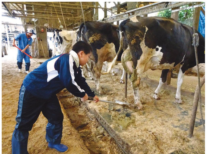
えひめジョブチャレンジU-15事業 酪農体験