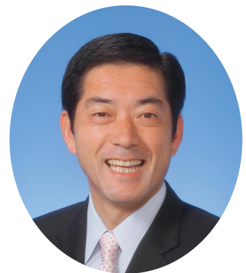
愛媛県知事 中村 時広