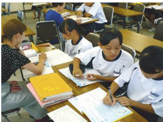
地域住民による学習支援

さらに、私立学校の経営が健全かつ安定的に行われるよう、その自主性を尊重しつつ運営の支援に努めていきます。