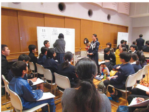
いじめSTOP！ えがお 愛顔あふれる 地域フォーラム

さらに、不登校をはじめ生徒指導上の課題の速やかな解決と防止のため、相談活動や学校を支援する体制を充実させるほか、児童虐待の兆候を的確に察知するため、職員研修や地域啓発を進めるとともに、福祉・医療・警察など関係機関との連携を強化し、早期に対応するなど、児童生徒の健全育成に取り組めます。