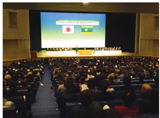
愛媛県人権・同和教育研究大会