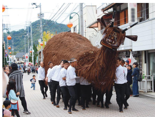
県指定無形民俗文化財 吉田秋祭の神幸行事