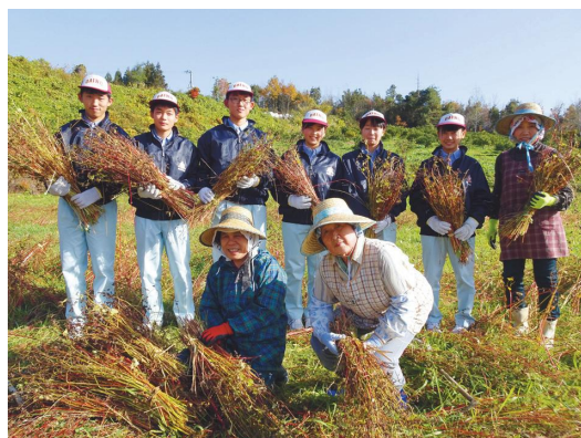
地域の文化を学ぶ（そば栽培）