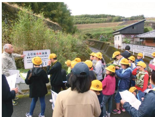
防災マップの作成

また、児童生徒の健康への配慮や快適な学習環境の確保の観点から、学校の教室へのエアコン設置促進に取り組むほか、教育の情報化を推進するため、教育用ICT機器等の整備に取り組み、安全・安心で充実した教育環境を確保していきます。